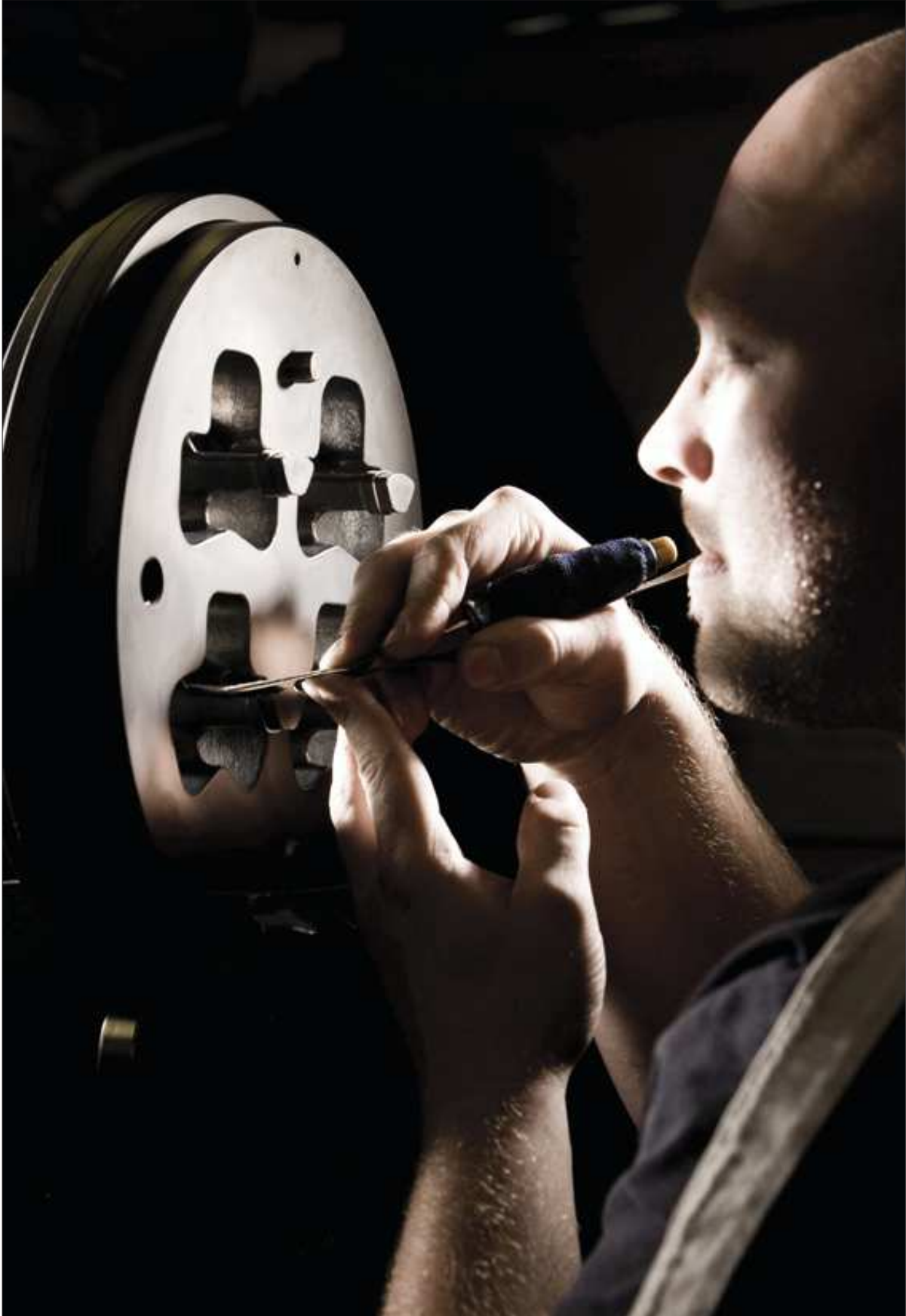
Fabricación de matrices